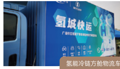
氢能冷链方舱物流车