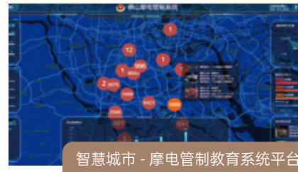
智慧城市 - 摩电管制教育系统平台