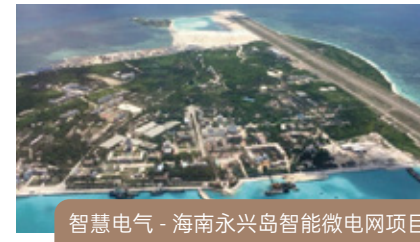
智慧电气 - 海南永兴岛智能微电网项目