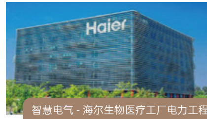
智慧电气 - 海尔生物医疗工厂电力工程