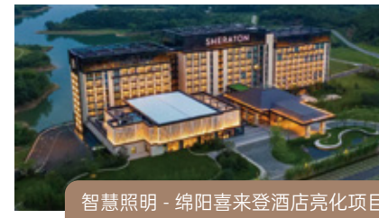
智慧照明 - 绵阳喜来登酒店亮化项目