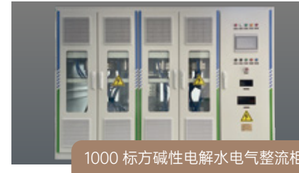
1000 标方碱性电解水电气整流柜