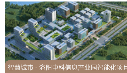
智慧城市 - 洛阳中科信息产业园智能化项目