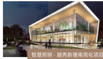
智慧照明 - 越秀新塘南亮化项目